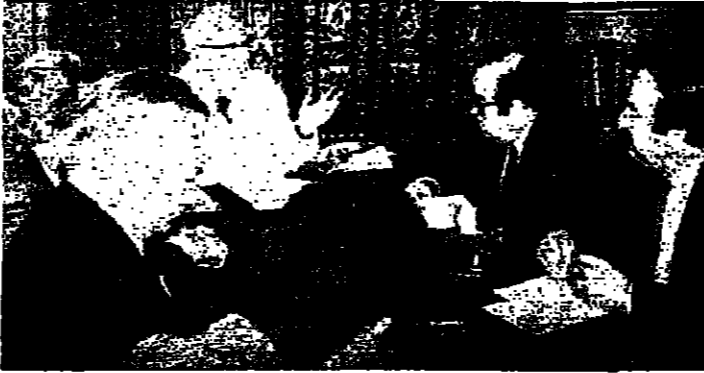
فرنجية خلال نومه الصحفية